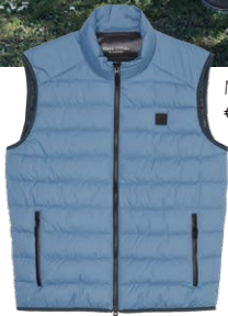
MARC O'POLO € 139,95