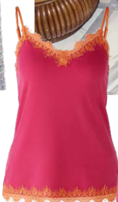
OUI € 69,95