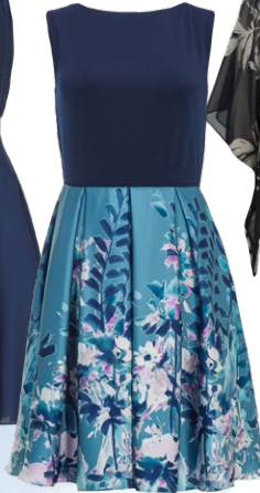
SWING € 159,99