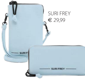
SURI FREY € 29,99