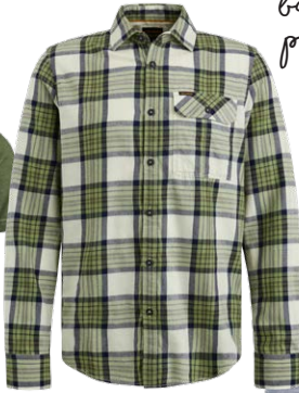
PME LEGEND € 69,99