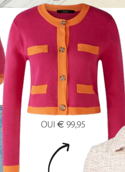
OUI € 99,95