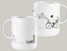
TASSE je € 22,95