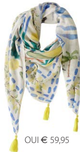
OUI € 59,95