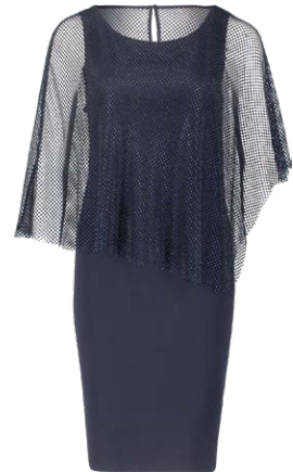
VERA MONT € 249