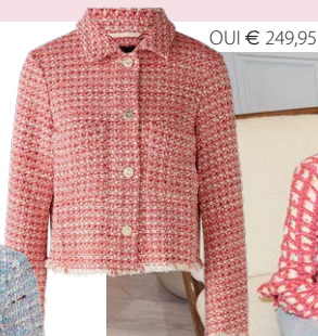
OUI € 249,95