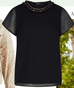
MARC AUREL € 119,95