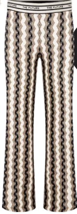
CAMBIO € 229,90