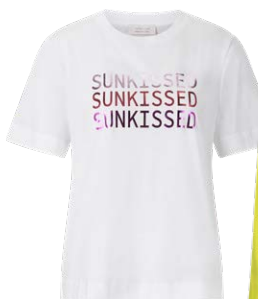
RICH & ROYAL € 49,95

Die Farbrange reicht von Pastell-Nuancen bis zu leuchtenden Fresh-Lemon-Tönen. Gelb allein strahlt schon den Sommer aus und kommt in Kombination mit leichten, seidigen Stoffen und Prints besonders zur Geltung.