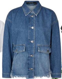
MARC AUREL € 159,95