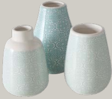
VASE ab € 4,99