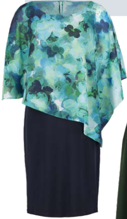
VERA MONT € 199,99