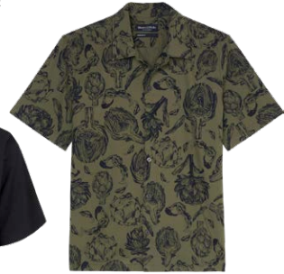
MARC O'POLO € 69,95