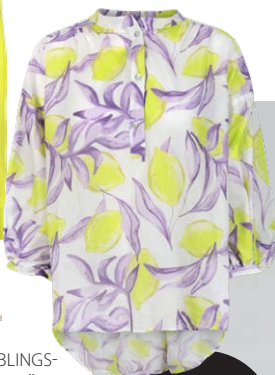
LIEBLINGSSTÜCK € 129,95