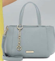
SURI FREY € 59,99