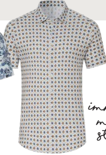
DESOTO € 89,99