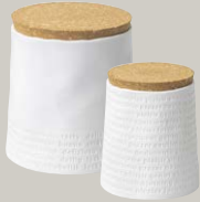
VORRATSDOSE ab € 29,95