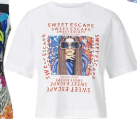
RICH & ROYAL € 59,95