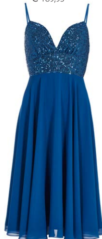
SWING € 189,99