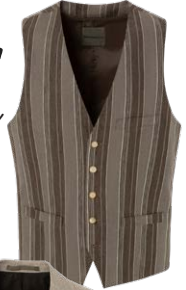
BENVENUTO € 129,95