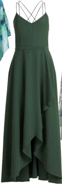
VERA MONT € 219