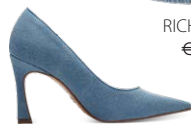
TAMARIS € 69,95