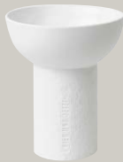
VASE € 49,95