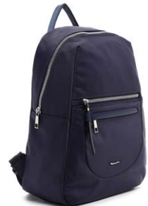
TAMARIS € 49,95