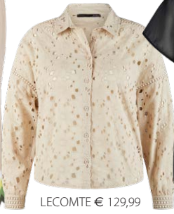
LECOMTE € 129,99