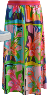
MILANO € 99,99