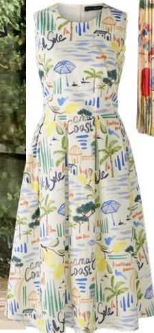
OUI € 179,95