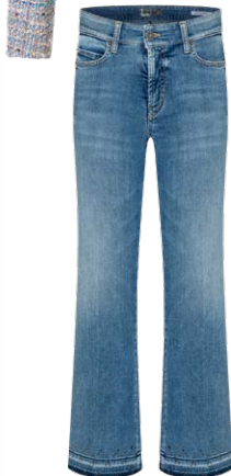
CAMBIO € 189,90