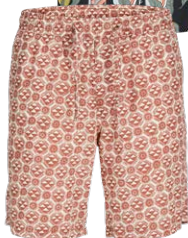
JACK &amp; JONES € 34,99