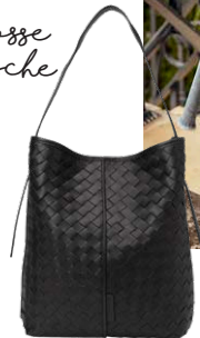
MARC O'POLO € 299,95