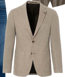
BENVENUTO € 199,95