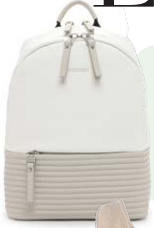
SURI FREY € 69,99