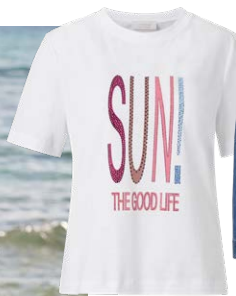
RICH & ROYAL € 49,95