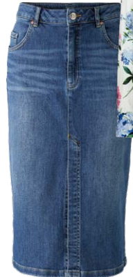
OUI € 119,95