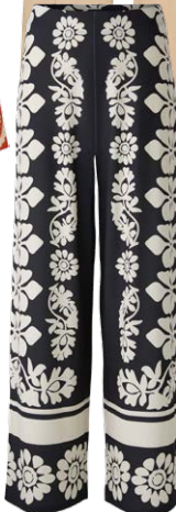
OUI € 119,95