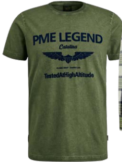
PME LEGEND € 49,99