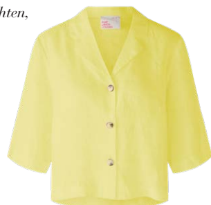
OUI € 139,95