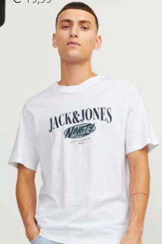
JACK &amp; JONES € 19,99