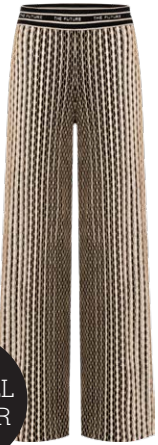
CAMBIO € 199,90