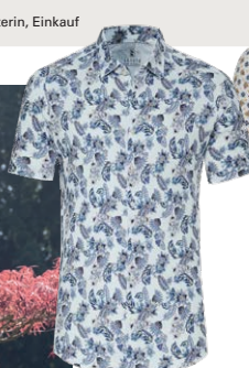
DESOTO € 89,99