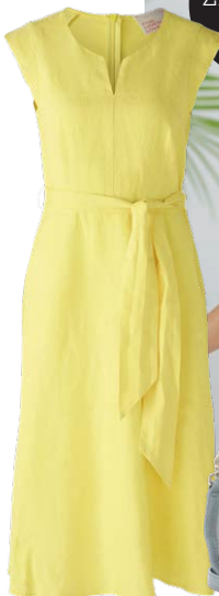
OUI € 179,95