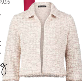
BETTY BARCLAY € 129,99