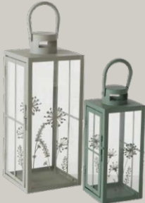
LATERNE ab € 29,95