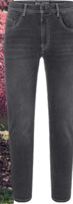
MAC € 109,95