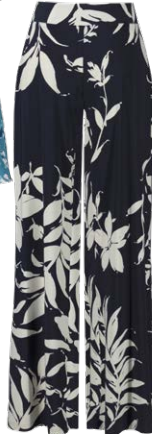
JOSEPH RIBKOFF € 189,95