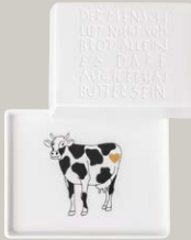
BUTTERDOSE € 28,95