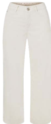
MAC € 109,95