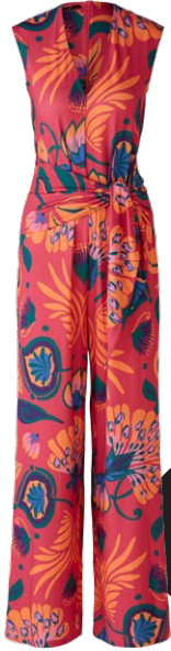
BETTY BARCLAY € 55,99

Fließende Stoffe, kräftige Farben und Mode, die Lust aufs Leben macht! Ob mit Blumenmuster, transparent, Midi oder Maxi – die leichten Lieblingsstücke schenken belebende Frische und angenehme Kühle. Lässige Hosen, luftige Kleider und super-angenehme Shirts wirken wie eingetaucht in Lebensfreude.