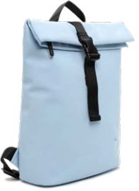
SURI FREY € 89,99

Denim gilt als ewiger Klassiker. Trendstarke Looks mit lässigen Jacken, coolen Hosenstyles, schmalen Röcken, Blusen, Hemden und sogar Schuhen - All-over Denim avanciert 2024 zum absoluten Must-have.