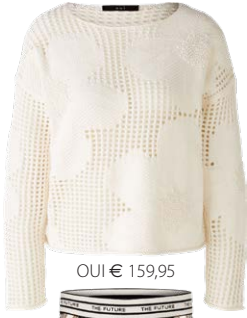
OUI € 159,95