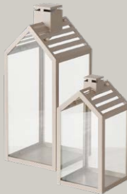
LATERNE ab € 19,99