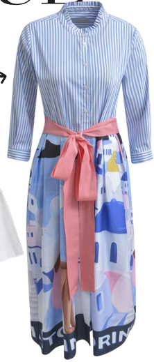
MILANO € 169,99