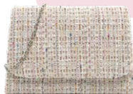
TAMARIS € 29,95