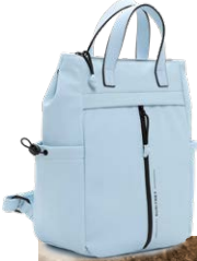
SURI FREY € 69,99