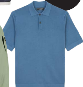
MARC O'POLO € 119,95