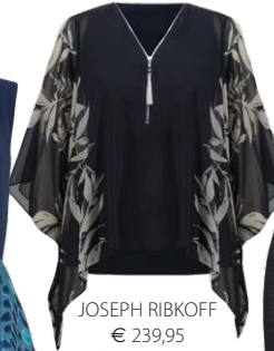
JOSEPH RIBKOFF € 239,95