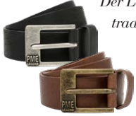
PME LEGEND je € 39,95

Der Look für den jungen, sportlichen Mann ist klassisch und schlicht in traditionellen Farben wie Blau, Grün und Beige. Zu den absoluten Must-haves zählen entspannte Jeans, lässige T-Shirts, leichter Strick, Karohemd und Sneaker.