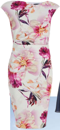
SWING € 149,99