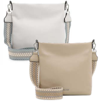
SURI FREY je € 49,99