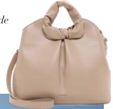
SURI FREY € 99,99