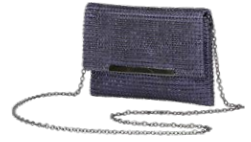
VERA MONT € 49,99