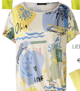
OUI € 79,95