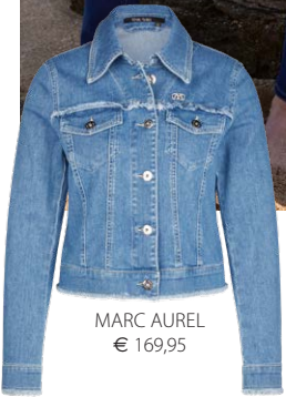
MARC AUREL € 169,95