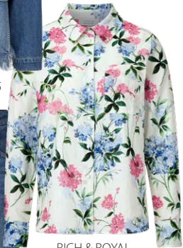
RICH & ROYAL € 129,95