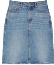
MARC O'POLO € 119,95