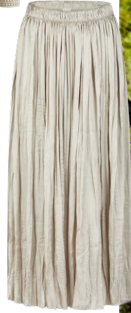
LECOMTE € 119,99