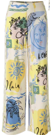
OUI € 119,95