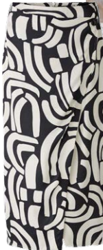
OUI € 129,95