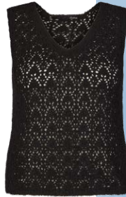
LECOMTE € 69,99