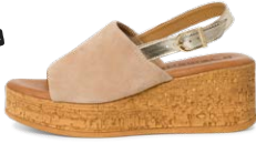
TAMARIS € 69,95