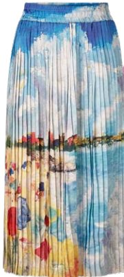
RICH & ROYAL € 129,95