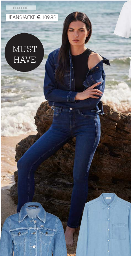
BLUEFIRE JEANSJACKE € 109,95