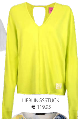
LIEBLINGSSTÜCK € 119,95