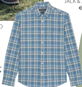
MARC O'POLO € 89,95