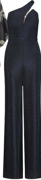
VERA MONT € 219