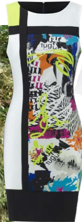
RIBKOFF € 289,95