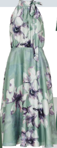
SWING € 229,99