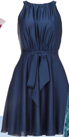
SWING € 149,99