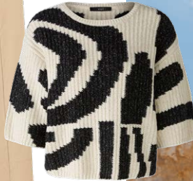
OUI € 139,95