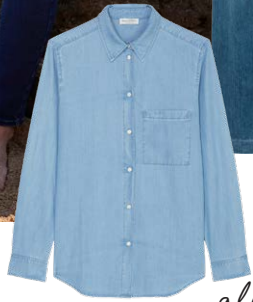
MARC O'POLO € 89,95