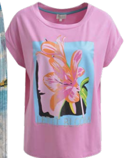
MILANO € 49,99