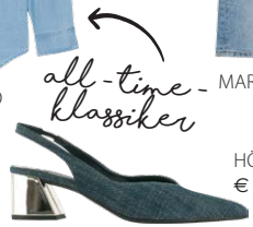
HÖGL € 149,90