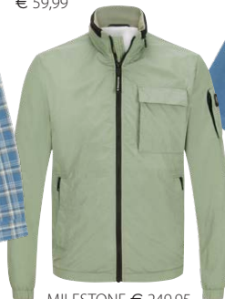
MILESTONE € 249,95