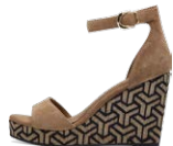
TAMARIS € 79,95