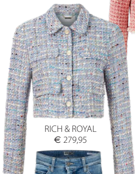
RICH & ROYAL € 279,95