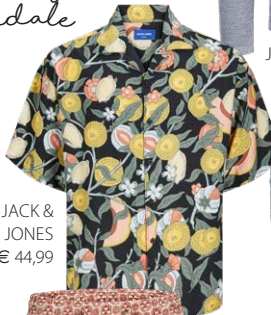
JACK &amp; JONES € 44,99