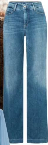
MAC € 119,95