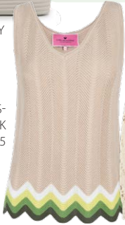
LIEBLINGS- STÜCK € 89,95