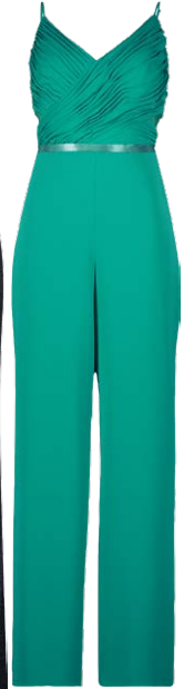
VERA MONT € 189,99