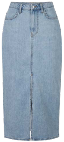
RICH & ROYAL € 129,95