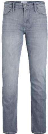
JACK &amp; JONES € 79,99