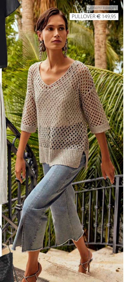
JOSEPH RIBKOFF PULLOVER € 149,95