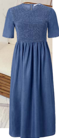
RICH & ROYAL € 179,95