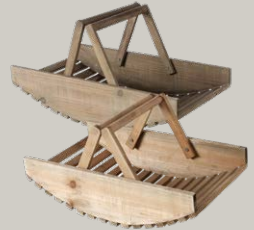
HOLZKORB ab € 34,95