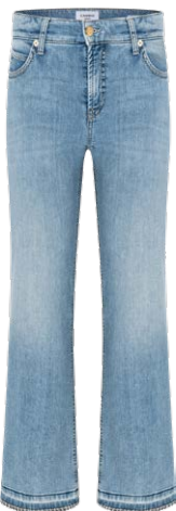
CAMBIO € 179,90