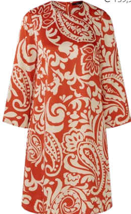
OUI € 149,95